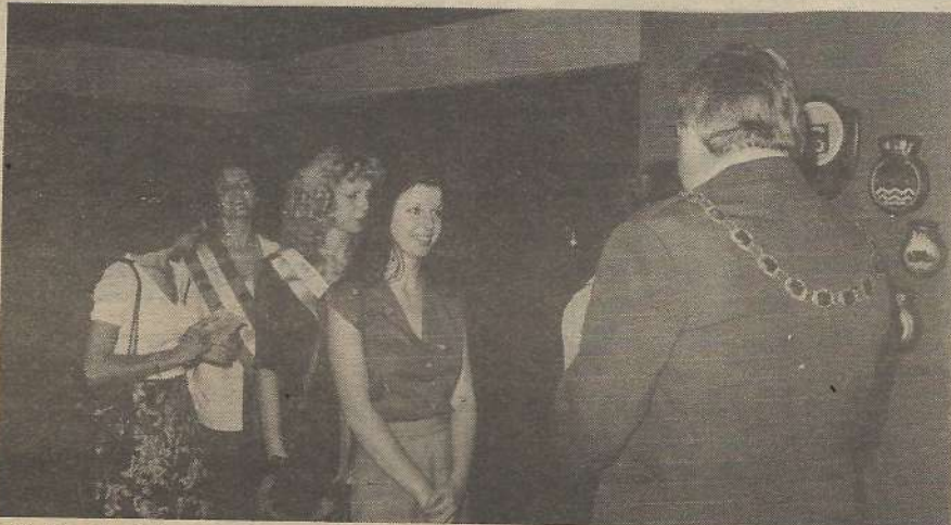
Medju brojnim gostima, uzvanicima na priredjenom banketu u gradskoj vijećnici grada Fremantle našle su se i naše mlade Miss Croatije.